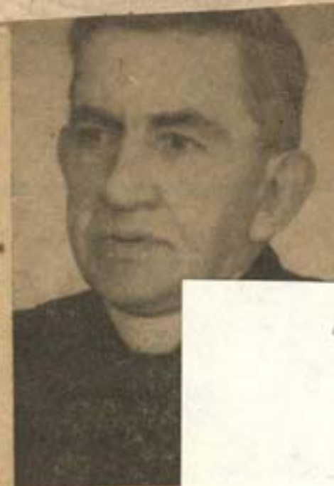
M. l'abbé ARM dont le service e eu lieu au début Princeville, le 25 avait été curé à S et St-Patrice de d'être nommé au des Frères du Sa baska et à l'Erm ville. R.I.P.

est à la recherche d'un (e) en pédiatrie et obstétrique-gyne-