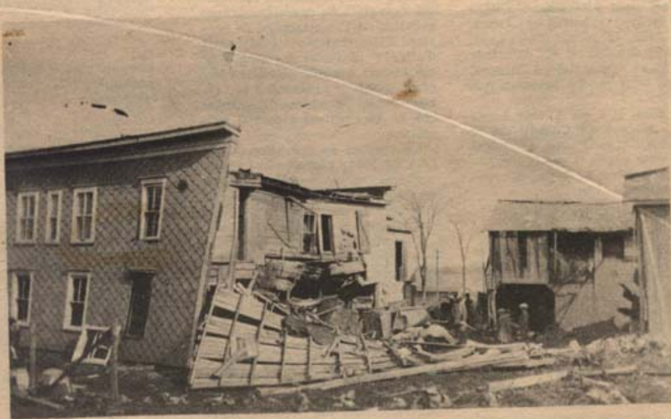
La laiterie Levasseur, située sur la rue Du Roi (magasin Sinclair d'aujourd'hui), a été plus que sérieusement ébraniée le 30 octobre 1928, quand une bouilloire fit explosion. On voit ici la façade et l'arrière de la bâtisse. M. Levasseur, qui se bécotait sur son balcon, a été projeté par la déflagration, mais n'a subi aucune blessure.